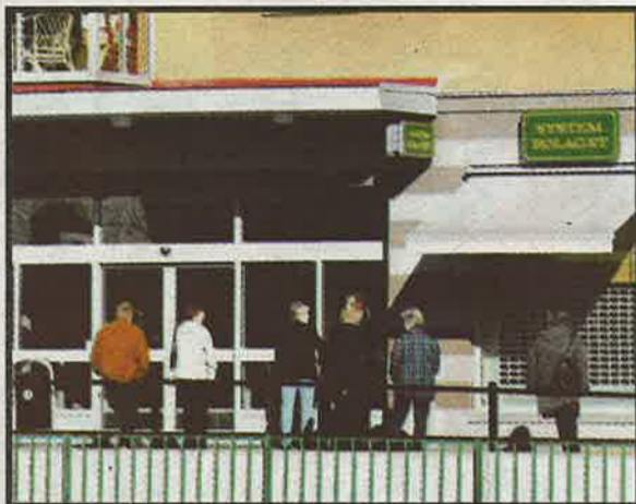
Bortimot ANKERDRAM: Båtturister i Strømstad vil fortsatt kunne handle ankerdrammen nede i sentrum.

Kilde: Vin- og brennevinleverandørenes forening (VBF)